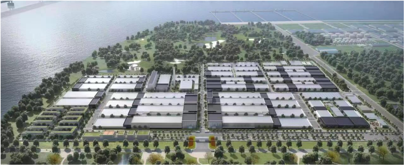
康辉南通新材料科技有限公司产业基地鸟瞰图