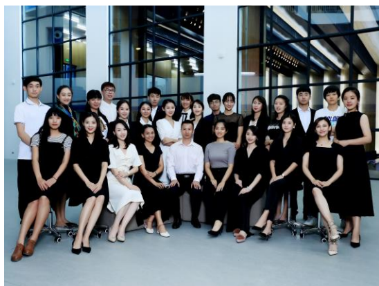
音乐舞蹈体育组教师合影

学校目前已招聘教师 131 名，其中特级教师 2 名，高级教师 6 名，一级教师 33 名；博士 11 名，硕士 87 名；海淀区学科带头人 6 名，骨干教师 11 人；上庄西北旺学区学科带头人 11 名，学区骨干教师 11 名。目前，绝大部分教师均已在航天城学校小学及初中部工作，部分中学教师在人大附中本部及联合学校有关成员校跟岗工作及培训，深入体验人大附中的教育理念，教学思想、校园文化等，提升专业化水平。