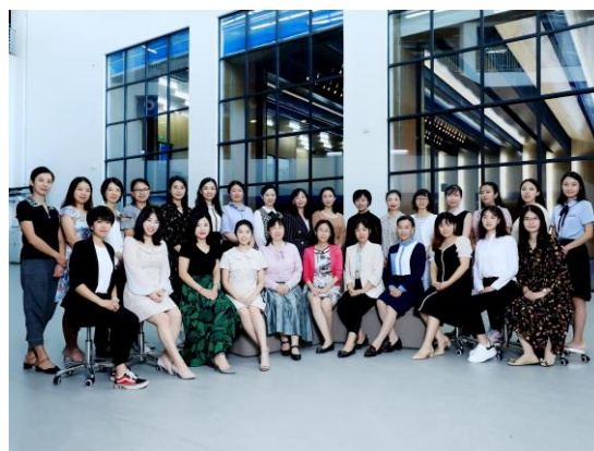
小学语文组教师合影